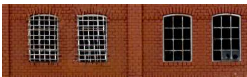
Linke Fenster mit verzinkte Schutzgitter...

Einen weiteren Einsatz des Fliegengitters, könnte ich mir im Bereich der Sicherheit vorstellen. Zum Beispiel um an Häusern und Fabrikgebäuden den Einbrechern das Leben schwer zumachen. Man könnte passende Stücke zuschneiden, die dann als Schmiedeeiserne Schutzgitter fungieren. Man kann sie für Fabrikgebäude verzinkt lassen. Für Einfamilienhäuser oder Bungalows können sie schwarz bemalt werden, was bei weißen oder hellen Häusern besonders gut aussieht.