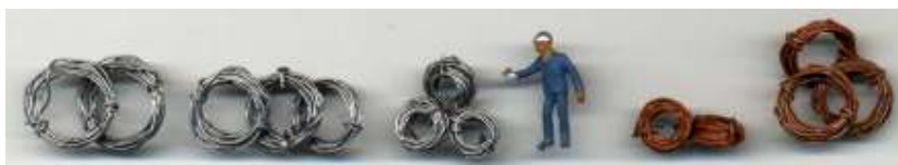
Drahringe in verschiedenen Größen

Es läßt sich aus den einzelnen Drahtlitzen aber auch Drahringe herstellen. Man kann sie in verschiedene Größen aufrollen, je nach eigenem Geschmack. Passende aufroll Möglichkeiten gibt es viele, z.B. Rundhölzer, Pinselschaft, kleine Rundfeilen, Bohrer usw.. Die beiden Drahtenden werden dann am besten mit Hilfe einer Pinzette um den eigenen Draht gebunden.