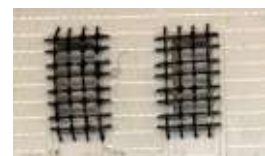
...und schwarze Schutzgitter