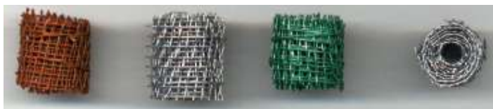
Drahtrollen verrostet, verzinkt, grün beschichtet

Die Zäune lassen sich aber auch als aufgerollte Meterware verkaufen, wie z.B. Maschendrahtzaun. Man kann die aufzurollenden Streifen längst abschneiden, oder aber diagonal, was einen Maschendrahtzaun näher kommt. Gebunden werden können sie wieder mit einzelnen Litzen. Diese Zäune kann man natürlich wieder verzinkt oder farbig beschichtet darstellen.