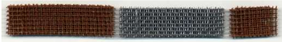
Baustahlmatten verrostet und verzinkt

Als Meterware gibt es in vielen Baumärkten Aluminium Fliegengitter zu kaufen. Aus diesem Material lassen sich viele Ausschmückungs- Gegenstände für die Modellbahn herstellen. Zum einen kann man daraus z.B. Baustahlmatten in der richtigen Größe ausschneiden. Man kann sie einzeln an der Baustelle plazieren, oder auch gebündelt zu mehreren Lagern. Mit aus den Fliegengittern einzeln seitlich herausgezogenen Litzen, kann man diese Bündel von Baustahlmatten auch sehr gut verzurren. Als nächstes sollte man sich überlegen ob man diese Baustahlmatten mit Rostfarbe behandelt, was optisch sehr gut aussieht, oder einfach so läßt, womit sie dann als Verzinkte Matten gelten.