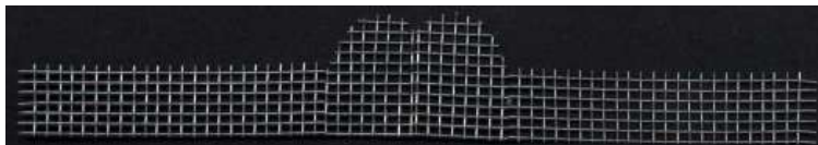
Zaun mit Toreinfahrt

Die Zäune lassen sich aber auch als aufgerollte Meterware verkaufen, wie z.B. Maschendrahtzaun. Man kann die aufzurollenden Streifen längst abschneiden, oder aber diagonal, was einen Maschendrahtzaun näher kommt. Gebunden werden können sie wieder mit einzelnen Litzen. Diese Zäune kann man natürlich wieder verzinkt oder farbig beschichtet darstellen.