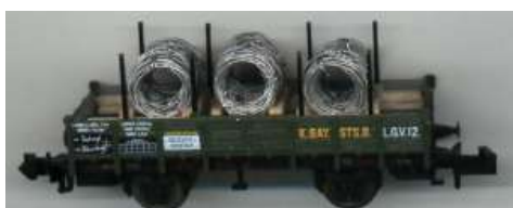
Drahringe als Ladegut

Diese Drahringe lassen sich natürlich auch hervorragend als Ladegut einsetzen. Ein passendes Gestell für die Aufnahme der Ringe kann man leicht selbst aus Balsaholz oder auch aus Streichhölzern herstellen.