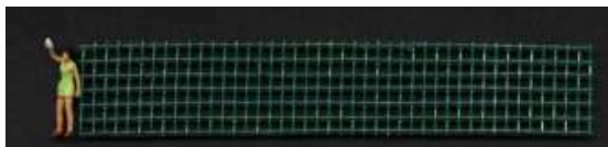
Zaun mit grüner Farbe behandelt

Sogar Toreinfahrten lassen sich darstellen. Man kann die Zäune verzinkt lassen oder man kann sie mit grüner Farbe bestreichen, womit sie im Modellbahnbereich als Pulverbeschichtet b.w. als Kunststoffbeschichtet gelten.