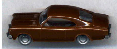
Von Wiking: Opel Record

Heiße Kisten gibt es in der Spur N nur sehr wenige, mir ist nur ein Fahrzeug bekannt. Es stammt von Marks Metallmodellclassic's und ist ein „Buick Limited Street Machine“ mit der Bestellnummer 5403. Aber ein richtig aufgemotzter Ofen, den kann man wie im richtigen Leben, halt nur im Selbstbau herstellen. Als Grundmodell habe ich mir den Opel Record von Wiking vorgenommen.