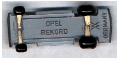
Fahrgestell mit installierten Reifen

Für die Aufnahme der Hinterräder müssen am Fahrgestell die Radkästen noch etwas weiter nach innen ausgeschnitten werden. Außerdem habe ich mit einer Vierkantfeile an der Stelle wo die Kegelförmigen Zahnstocherachsen angebracht werden, eine Fase in die Karosserie eingefeilt, damit die Reifen auch optimal sitzen.