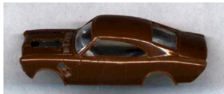
Fahrzeug nach der Karosseriebearbeitung

Die Stoßstangen mussten als erstes entfernt werden. Dazu habe ich das Fahrgestell von der Karosserie getrennt. Nach dem abtrennen der Stoßstangen wurden die zwei teile wieder lose zusammen gefügt. Damit die eckigen Einschnitte an der Karosserie, dort wo die Stoßstangen saßen und wegen der besseren Optik, wurde die Front und Heckpartie schräg abgeschliffen. Zur Aufnahme des neuen Motors wurde in der Motorhaube eine passende Öffnung angebracht. Diese Öffnung wurde in der Größe so gewählt, das die Zylinderköpfe und alles was sich darüber befand, aus der Motorhaube herauschaute. Der Motor ist eine V-8 Maschine und kommt aus Übersee von der Firma Micro Engineering .