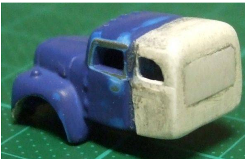
Das Heck vom Wiking Wohnwagen dient nun als Schlafkabine.

Das Modell von Classic Model Works wurde erst mal in seine Einzelteile zerlegt. Dann überlegte ich wie ich am besten die Schlafkabine herstellen sollte.