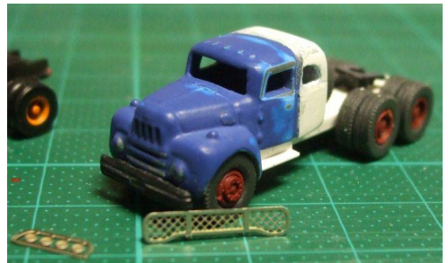
Erste Stellprobe mit einigen Anbauteilen vor der Lackierung.

In meinen Fundus war noch ein Bausatzrest von einem Wiking Wohnwagen dem ich das Hinterteil absägte. Ein paar zusätzliche Kunststoffplatten bracht die Grundform herein. Das Teil wurde mit der Fahrerkabine verklebt und anschließend mit viel feilen und schleifen in Form gebracht. Die zusätzlichen Seitenfenster wurden ausgebohrt und vorsichtig mit einer kleinen Feile in Form gebracht. Die Vorderen Radläufe wurden mit einem Schleifstein vergrößert, damit die schweren Littke-Räder hinein passen. Das Fahrgestell wurde aus Kunststoffprofilen gebaut und bekam eine Doppelhinterachse.