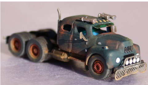
Vorderansicht mit umgebauten Rammschutz und selbstgebauter Sonnenblende

So kamen z.B. Spiegel aus dem Set 4 zum Einsatz die von der Größe her wunderbar passten. Am Heck wurden Spritzschutzlappen und Heckblende angebracht und mit den in Siebdruck-Verfahren hergestellten Decals versehen. Das schöne an den Decals von FKS-Modellbau ist, das sie sich Konturenscharf ablöst und kein passgenaues Ausschneiden nötig ist.